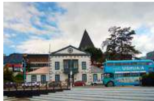
Un'immagine di Ushuaia , la cittadina più a sud del mondo, tappa finale della crociera nella Terra del Fuoco .

notte a Buenos Aires in hotel 5 stelle, due notti a El Calafate in hotel 4 stelle, due notti a Puerto Natales in hotel 4 stelle, la crociera Australis "I Fiordi della Terra del Fuoco" di 4 notti/5 giorni a bordo della motonave Stella Australis, da Punta Arenas a Ushuaia con passaggio e sbarco a Capo Horn e un'ultima notte a Buenos Aires in hotel 5 stelle. Il pacchetto include anche trasferimenti e tour guidati nelle diverse località. Il prezzo parte da 3.963 € a persona per