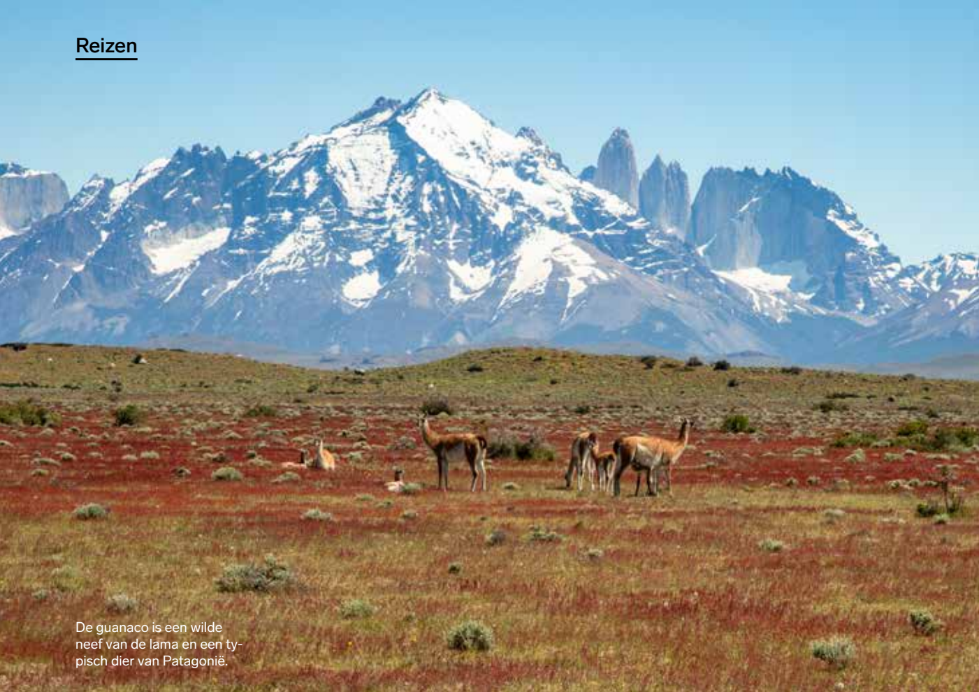
De guanaco is een wilde neef van de lama en een typisch dier van Patagonië.