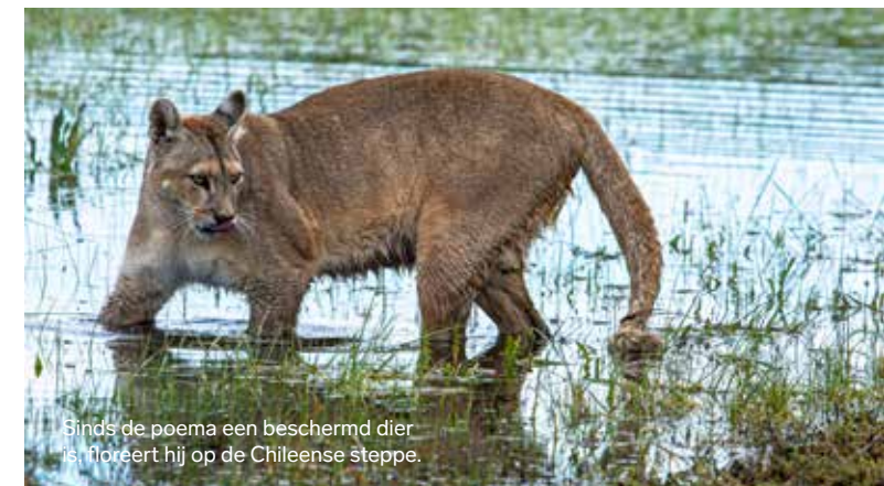
Sinds de poema een beschermd dier is, floreert hij op de Chileense steppe.

waarvan de natuur, cultuur, architectuur, mythologie en mensen zich door hun eeuwenlange isolatie onderscheiden van de rest van Chili. Hier kun je de beroemde palafitos bewonderen, veelkleurige hutten gebouwd op palen in lange rijen langs de waterkant. Sommige worden nu gebruikt als winkels, restaurants of pensions, maar de meeste worden nog steeds bewoond door de lokale bevolking.