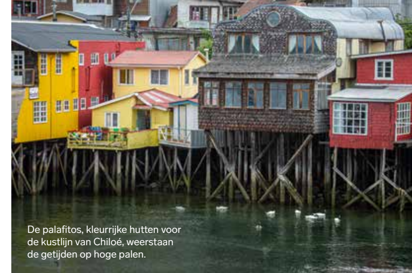
De palafitos, kleurrijke hutten voor de kustlijn van Chiloé, weerstaan de getijden op hoge palen.