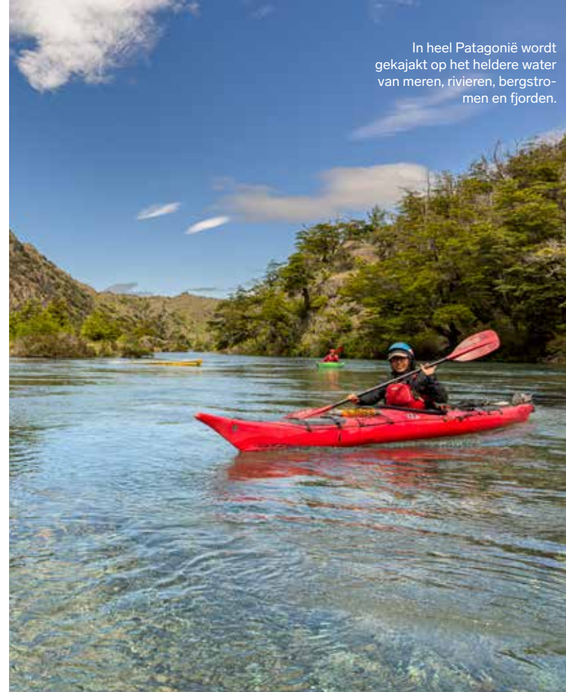
In heel Patagonië wordt gekajak op het heldere water van meren, rivieren, bergstromen en fjorden.