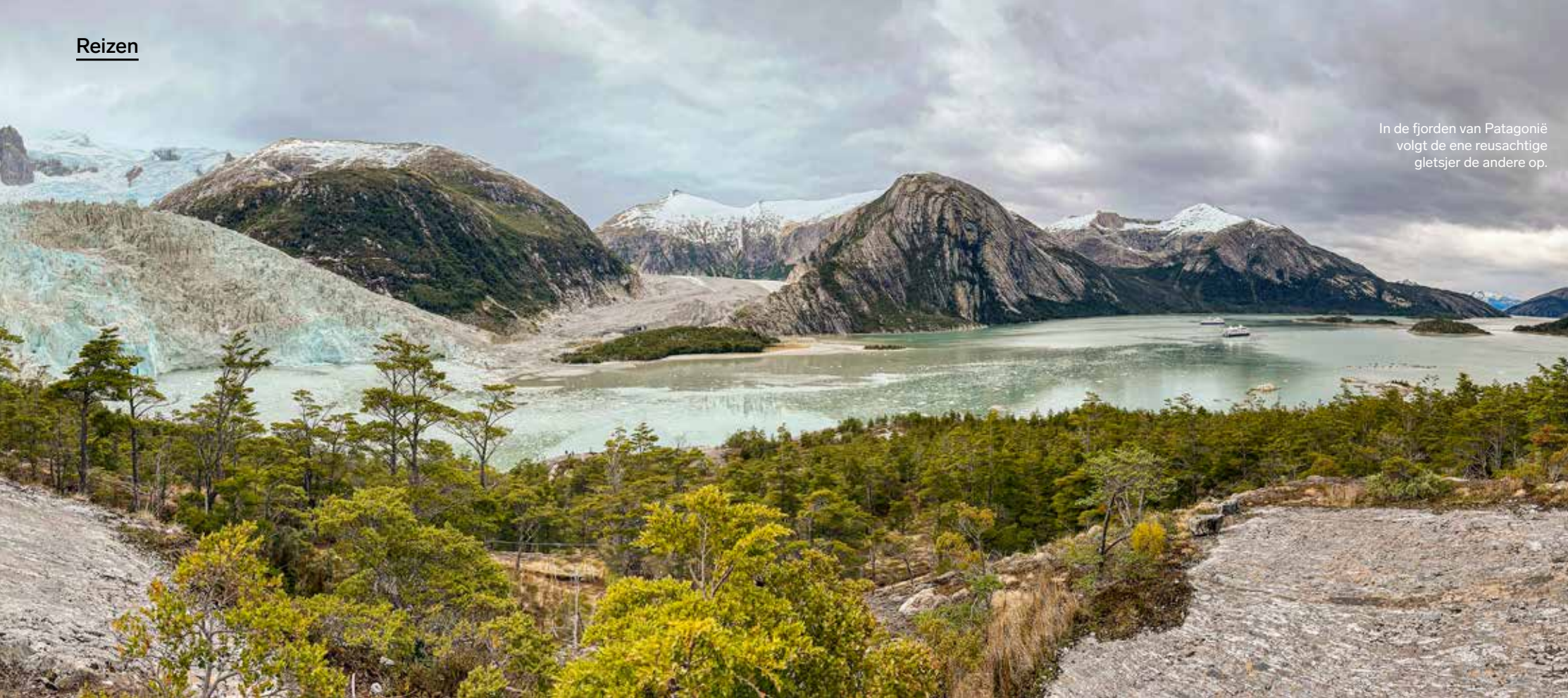
In de fjorden van Patagonië volgt de ene reusachtige gletsjer de andere op.